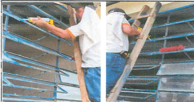
Foto 3: Se realizan los trabajos de instalación y sustitución de vidrios.