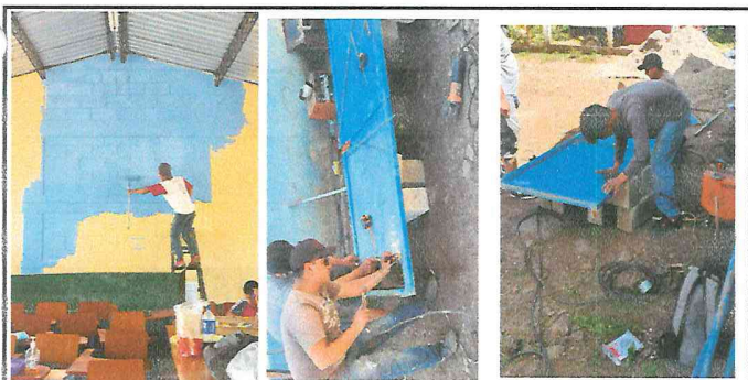
Foto 5: Se realizan los trabajos de pintura en muros interiores y exteriores así como las puertas que requieren mantenimiento.-