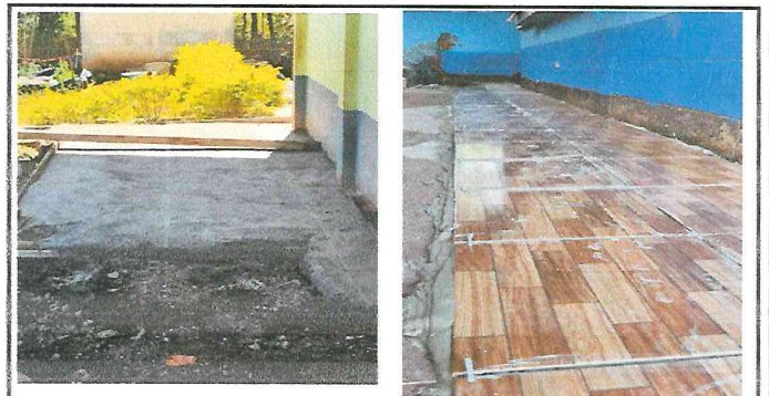
Foto 4: Se realizan los trabajos de sustitución de piso de torta de concreto.-