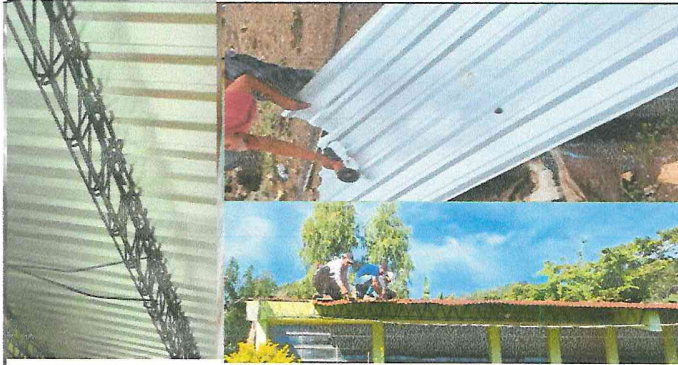
Foto1: Se realizan los trabajos de sustitución de lámina por lamina troquelada.