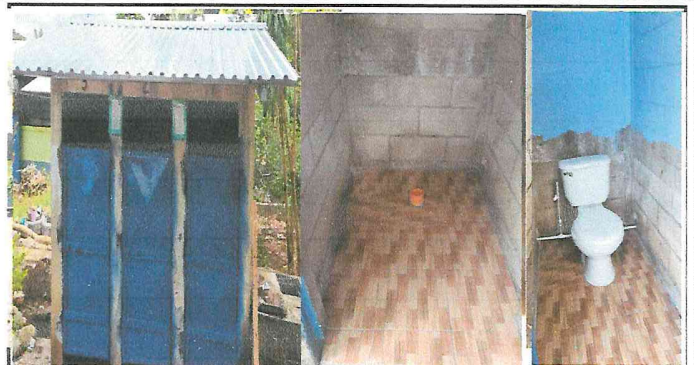
Foto 2: Se realizan los trabajos de sustitución de lámina y estructura metálica en el techo de los baños, así como de las puertas y los inodoros